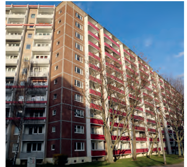
Das Gebäude Rigaer Straße

Direkt gegenüber des Gebäudes Rigaer Straße befindet sich das Einkaufszentrum „Moskauer Meile“ – ein guter Nahversorger, der nahezu alle Waren für den täglichen Bedarf anbietet. Nur wenig weiter entfernt liegt der Thürin-