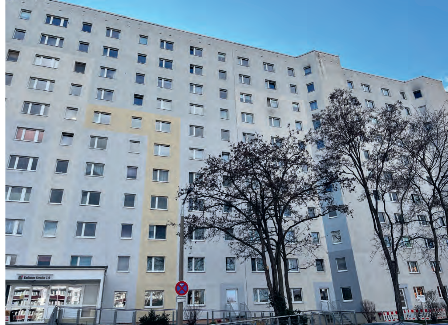
Das Gebäude Sofioter Straße 7 – 9