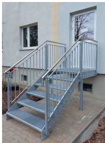
Montage der Treppen