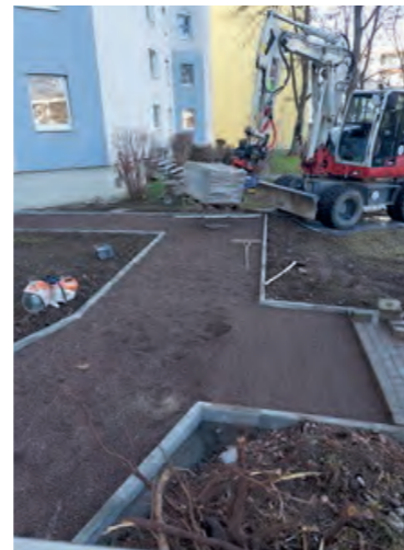
Anlegen der neuen Wege