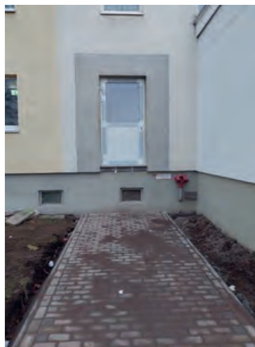
Pflasterung der Zuwegungen