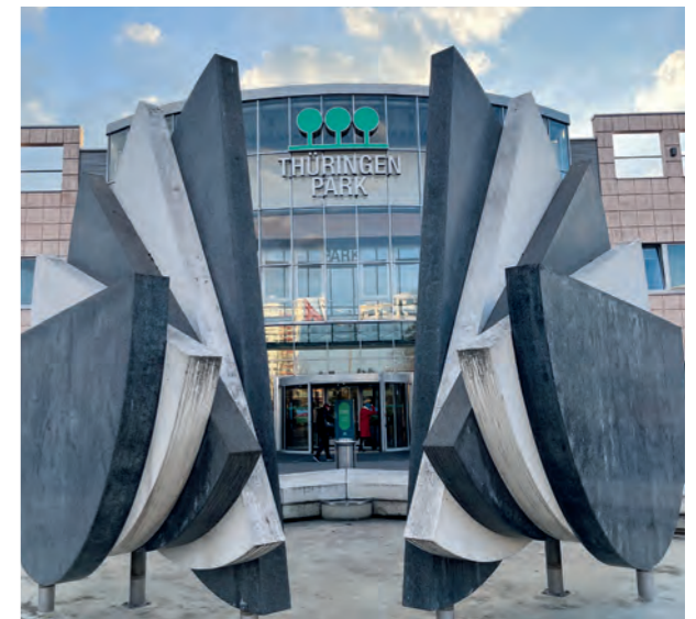
Der Thüringen-Park, Thüringens größtes Einkaufszentrum