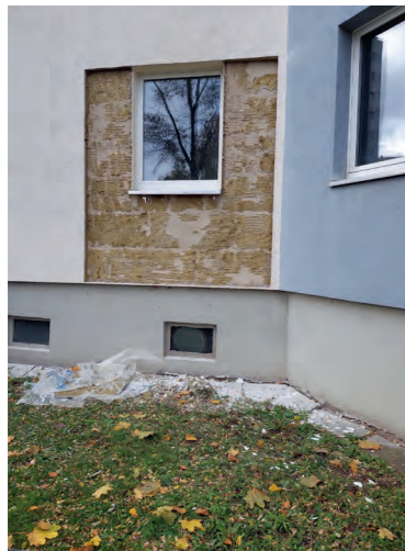
Entfernung der Fassadendämmung im Bereich des neu zu schaffenden Notausganges; Erdaushub für Fundamente und deren Erstellung

Alles in allem bedeutet das Verfahren einen hohen Zeit- und Kostenaufwand. In der Sofioter Straße sind insgesamt sechs zusätzliche zu den drei bereits vorhandenen Ausgängen hinzugekommen.