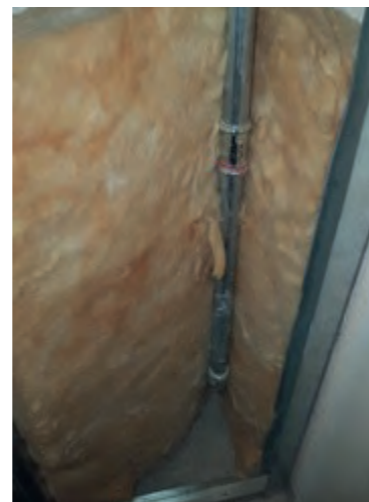
Anarbeitung der Innenwände und der Fußböden