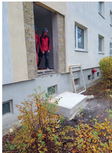
Ausbau der Fenster, Herstellung der Türöffnung mittels Betonsägearbeiten, Notsicherung der Öffnung, Einbau der neuen Türen, Anarbeitung der Fassadendämmung