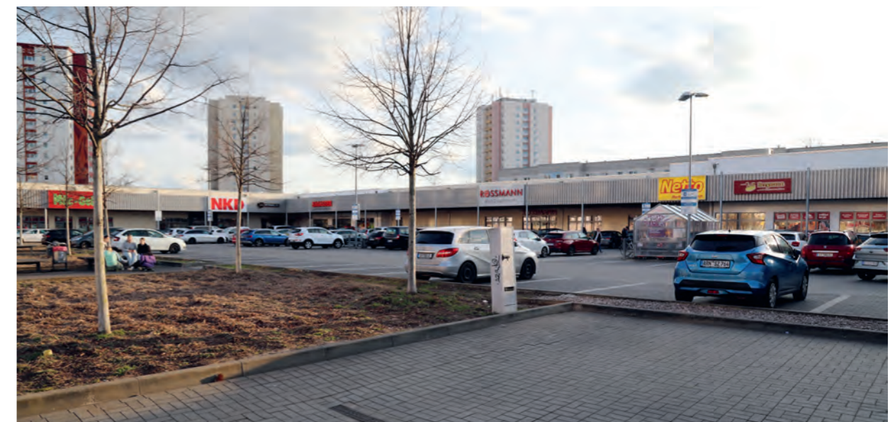
Die „Moskauer Meile“ bietet umfassende Nahversorgung direkt gegenüber.